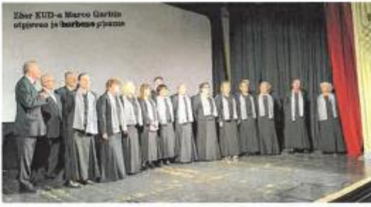
Zbor KUD-a Marco Gartin otvoren je barbarske pjesme

Krajem kolovoza 1944. godine odlučeno je da se iz istrske izvuku sve partizanske postrojbe, pa su i pripadnici «Pina Budicina» preko Kvarnerskog zaleđa i Krassa otišli u Gorski kotar, odakle su djelovali i na Opuzenskom