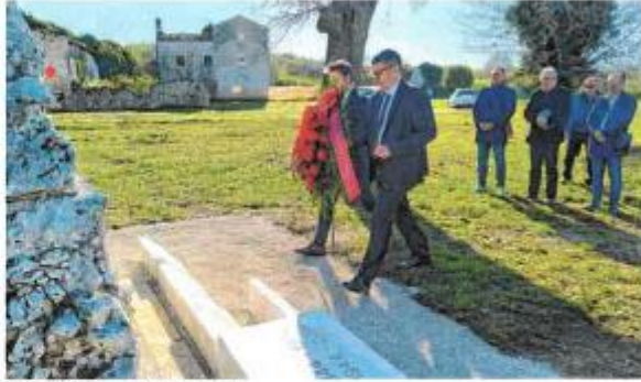
Polaganje vijenaca u Stanciji Bembo

Obilježavanje je započelo polaganjem vijenaca na Stanciji Bembo, a središnja svečanost održana je u kazalištu Gandusio uz predstavljanje izložbe i videoprojeksijske posvećene bataljunu, koju je pripremio Muzej Grada Rovinja